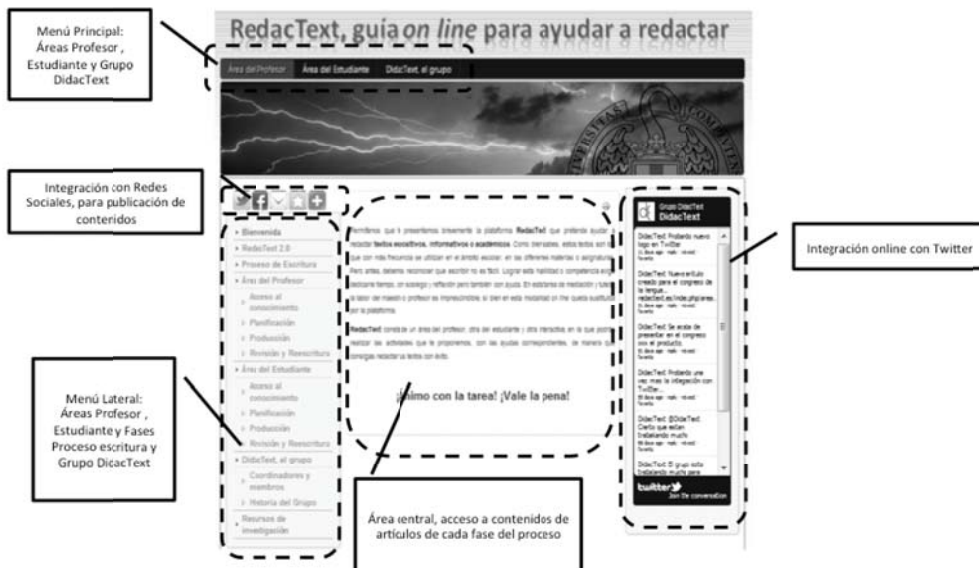
Figura 1: Secciones de la plataforma RedacText 2.0.

La plataforma RedacText 2.0, según se ilustra en la figura 2, ofrece diferentes vías de interacción para sus usuarios; a saber: